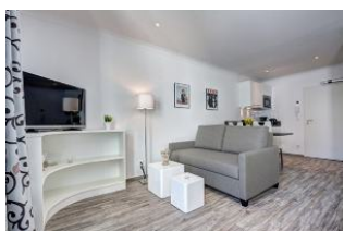
TV und Couch