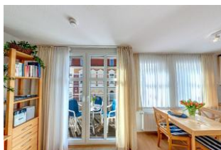
Essbereich mit Blick auf die Terrasse