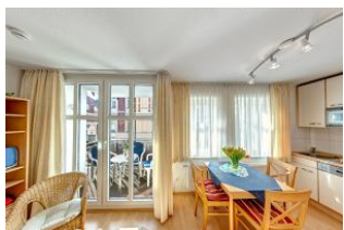
großzügiger Essbereich und Küche

Direkt an der Strandpromenade mit SÜDBALKON und FAHRSTUHL im Haus! Schönes geräumiges 2-Zimmer-Apartment mit moderner guter Ausstattung. Separates Schlafzimmer, Wohnzimmer mit Küchenzeile und Essplatz, Duschbad, Balkon nach Süden mit Sonne bis abends. Die Wohnung verfügt über einen Tiefgaragen-Pkw-Stellplatz. In der Garage können auch Fahrräder und ähnliches untergestellt werden. In unserer "Villa Germania" nebenan gibt es eine Sauna. Von der "Villa Aquamarina" aus können Sie das Ortszentrum und die bekannte Ahlbecker Seebrücke in ca. 3 Minuten zu Fuß erreichen. Zum Strand sind es 50 m.