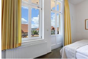
Schlafzimmer mit Blick zur Balkontür