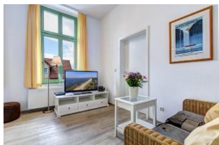
Wohnbereich mit TV

STRANDNAH mit SÜDBALKON! Nur ca. 100 m zur Strandpromenade! Schönes 2-Zimmer-Apartment mit gemütlicher und guter Ausstattung. Separates Schlafzimmer, Wohnzimmer mit Küchenzeile und Essplatz, Duschbad, Südbalkon. Die Wohnung verfügt über einen Pkw-Stellplatz. Abstellraum für Fahrräder und ähnliches ist vorhanden. Eine Sauna in der "Villa Germania" kann kostenpflichtig genutzt werden. Vom Haus aus können Sie das Ortszentrum und die bekannte Ahlbecker Seebücke in ca. 3 bzw. 5 Minuten zu Fuß erreichen.