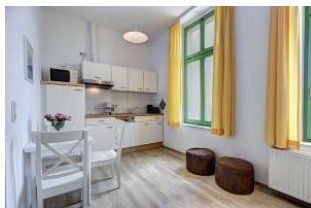
Küche und Essen