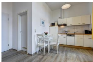
Küche und Essen mit Blick zur Badtür