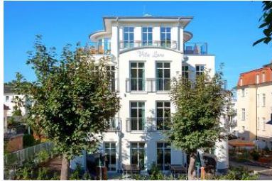
Hausansicht aus der Architektenplanung