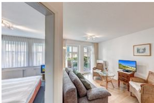
Türe zum Schlafzimmer